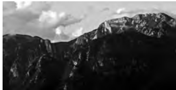
Monte Terminio dal Monte Vernacolo