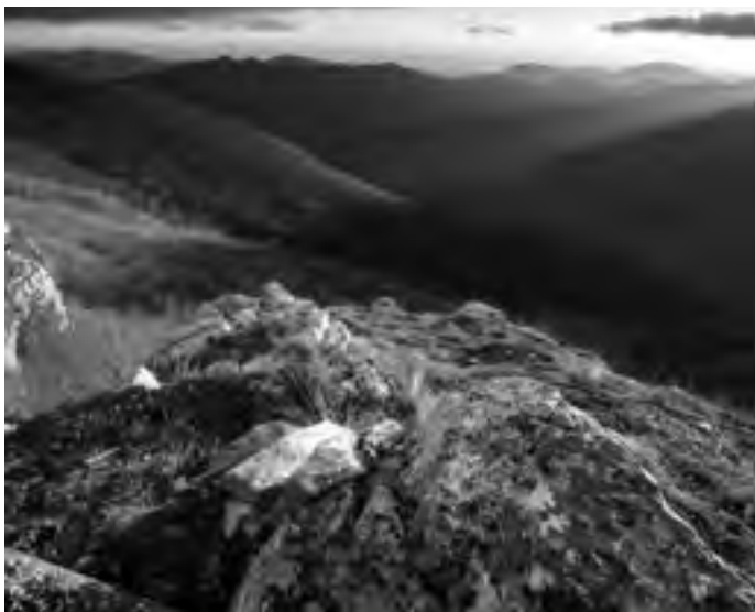
Ripe della Falconara

Caserta - Parco Nazionale del Gran Sasso e Monti della Laga Vetta centrale/Torrione Cambi del Corno Grande per la forchetta del Calderone Programma dettagliato in sede e su www.caicaserta.it Direttori: Eugenio Calcagno - 375.6264211 Ciro Bologna - 329.2328150