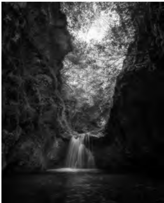
Fiumara di Tannerà