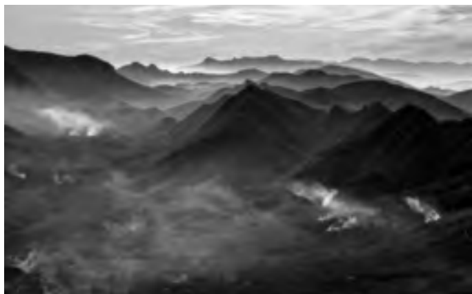
Panorama dalle neviere di Solofra

Direttori: Vilma Tarantino - 333.2530525 Michelina De Cicco - 339.4238446 Raissa Tarantino - 366.4266575