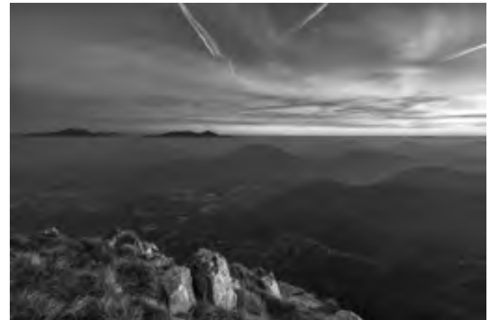
Monti Picentini visti dai Monti del Partenio