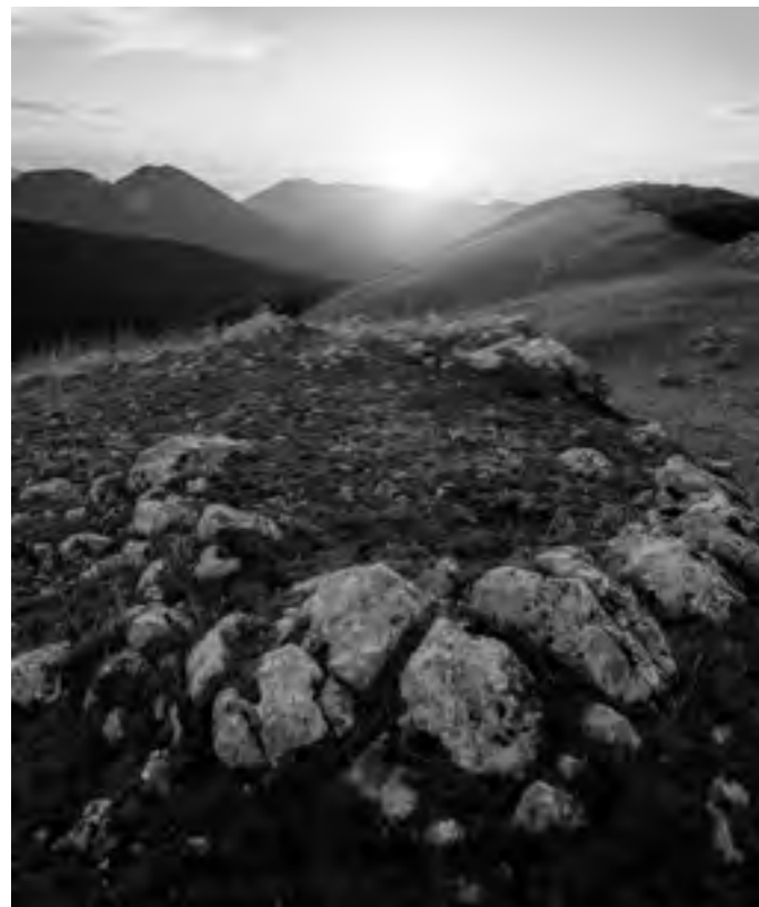
Tramonto dal Monte Raiamagra