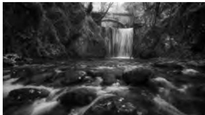
Ponte del Fascio - Montella