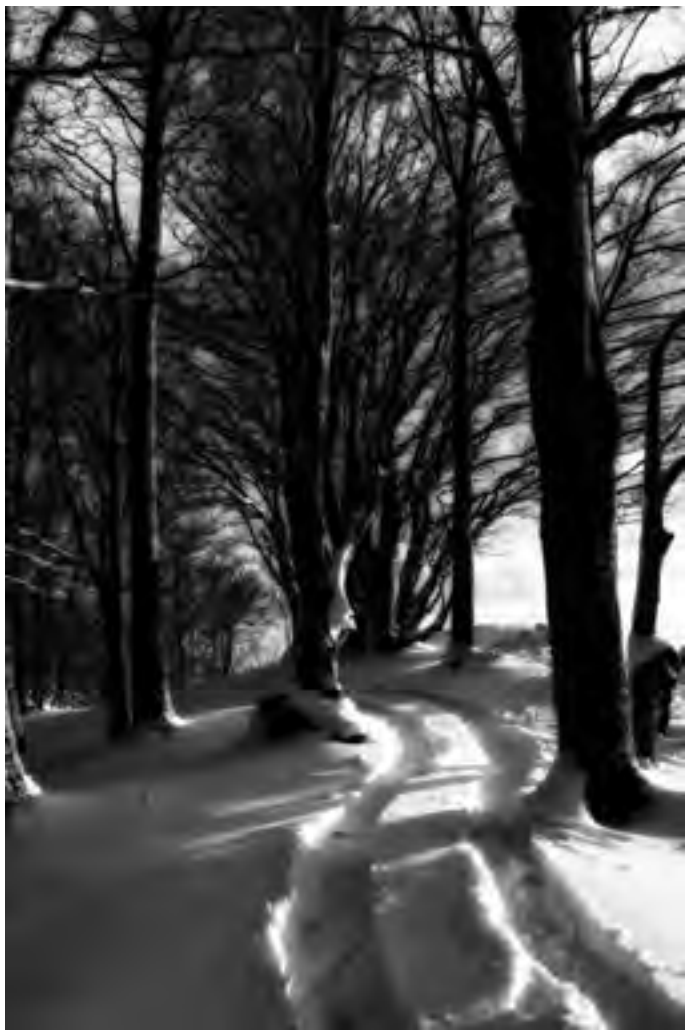
Ripe della Falconara

Il programma delle attività riportate in questo volume è consultabile sul sito